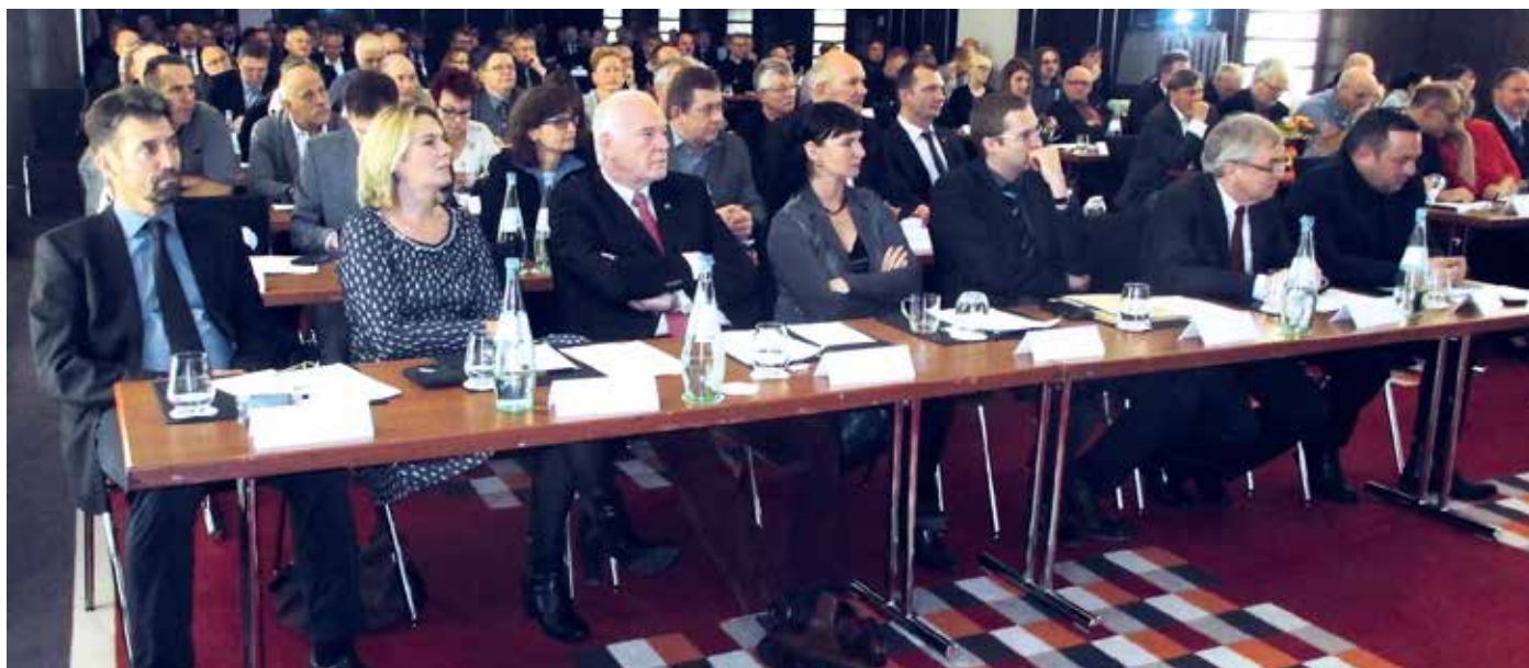
Der Einladung zum 39. BSBD-Gewerkschaftstag nach Rostock waren viele Gäste aus Politik, Ministerien und Vollzugsanstalten gefolgt.

schaffung des Beamtenstatus die Funktionsfähigkeit des öffentlichen Dienstes in Frage stelle. Der Beamtenstatus ist in der Bundesrepublik im Grundgesetz fest verankert und unteilbar mit dem öffentlichen Recht verbunden. Unser Staatsapparat kann nicht ohne den Beamten funktionieren!