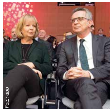
Hannelore Kraft, Ministerpräsidentin NRW und Thomas de Maizière, Bundesinnenminister.